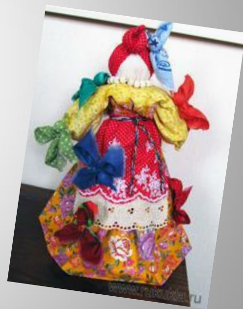
Кукла - Радость