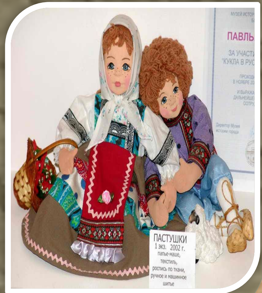
ПАСТУШКИ 1 экз. 2002 г. папье-маше, текстиль, роспись по ткани, ручное и машинное шитье