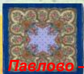
Павлово – Посадские платки