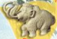
РЕЗЬБА ПО КОСТИ