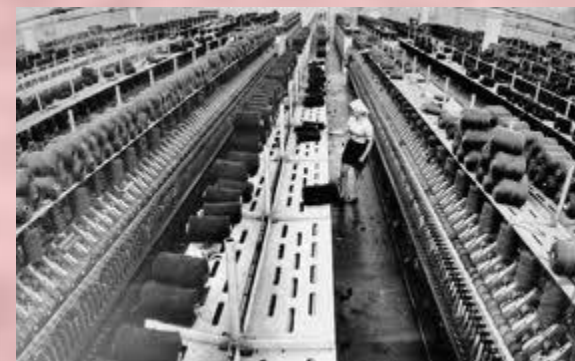
Ткацкий цех. Германия 1860 год