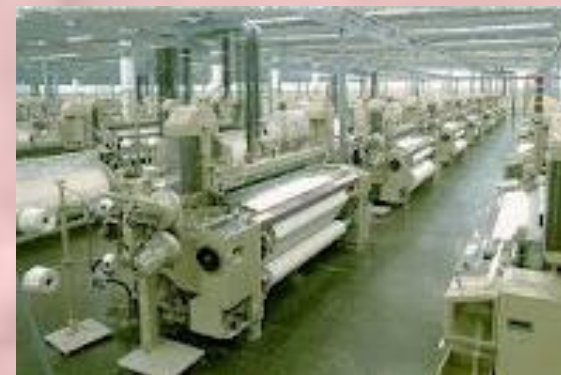
Более скоростные ткацкие машины - бесчелночные