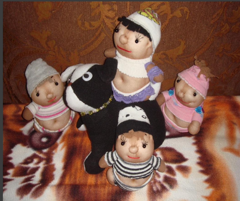
Мой выбор - капроновые пупсы.