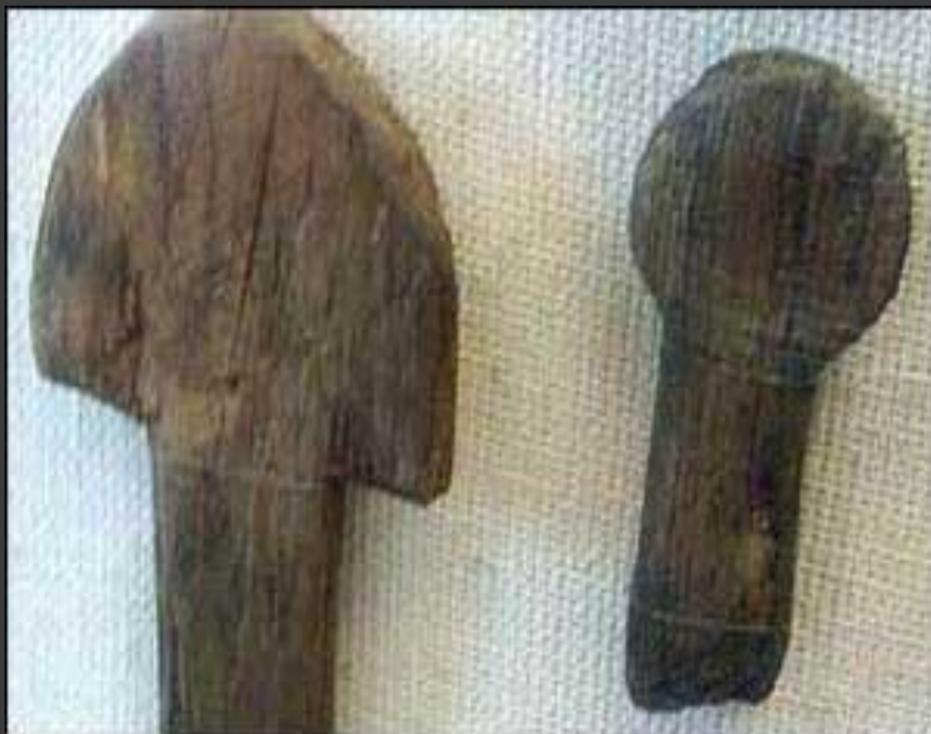
Игрушки 12-13 веков.

Искусство изготовления игрушек - это один из древнейших видов народного художественного творчества.