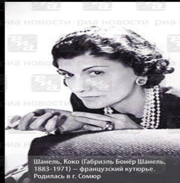
Шанель, Коко (Габриэль Бонёр Шанель, 1883–1971) – французский кутюрье. Родилась в г. Сомюр

Коко Шанель: «Главное в женщине не одежда, а милые манеры, рассудительность и строгий режим дня»