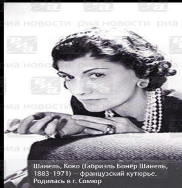
Шанель, Коко (Габриэль Бонёр Шанель, 1883-1971) – французский кутюрье. Родилась в г. Сомюр

Коко Шанель: «Главное в женщине не одежда, а милые манеры, рассудительность и строгий режим дня»