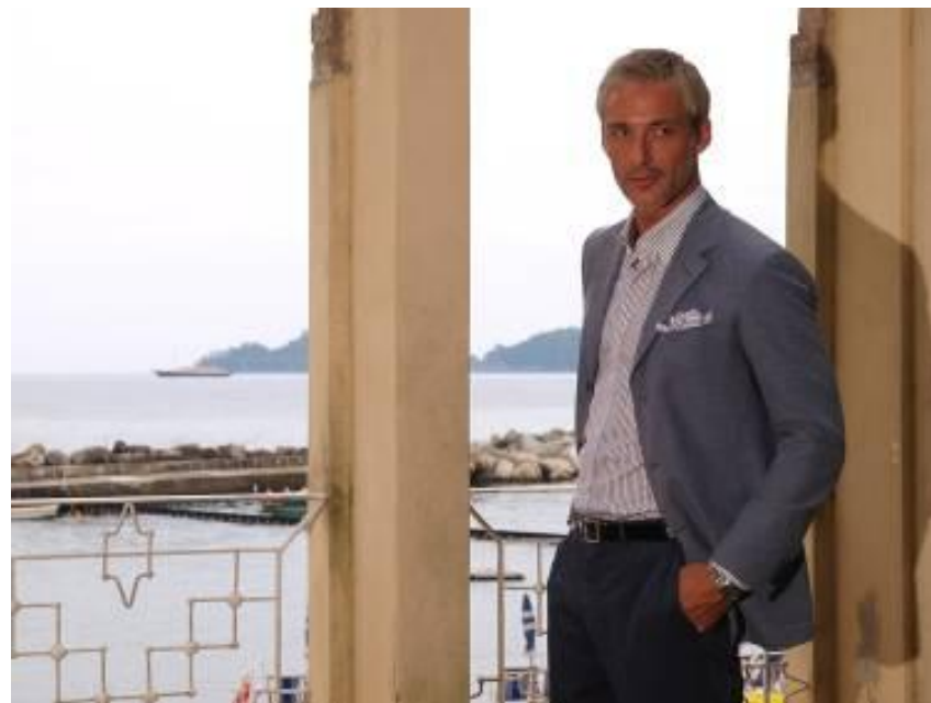
Пиджак SOFT G3 Брюки 441X