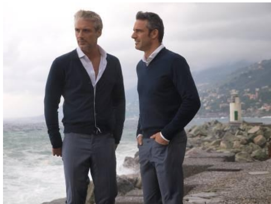
Кардиган Bicolore 1AE11F