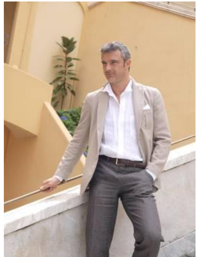
Сорочка СМОКИНГ Пиджак Portofino Брюки 341