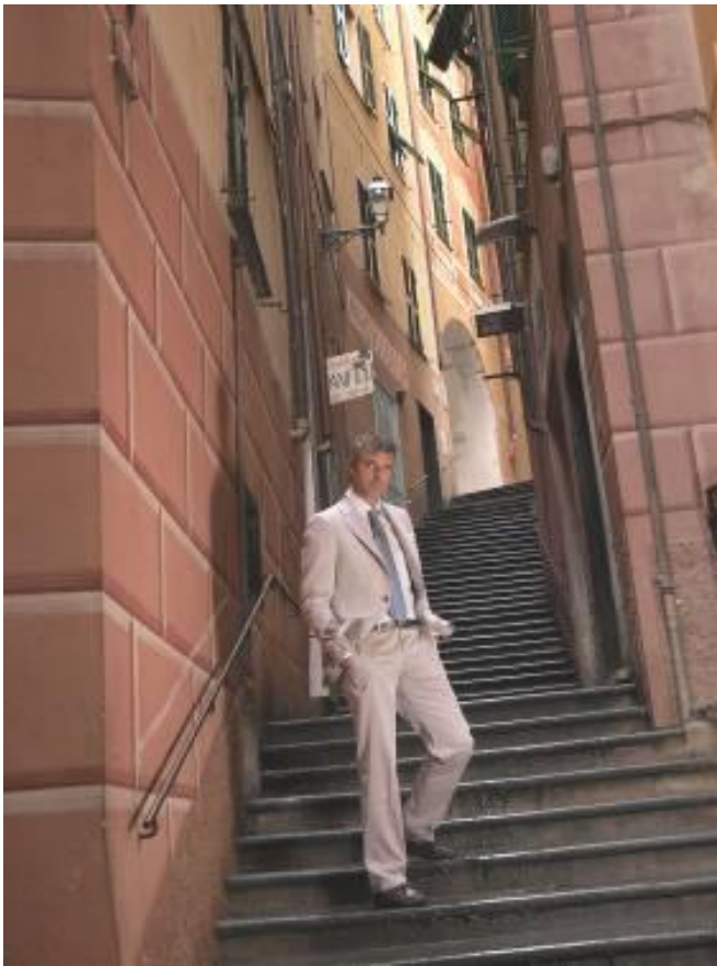
Костюм DECO A2NP