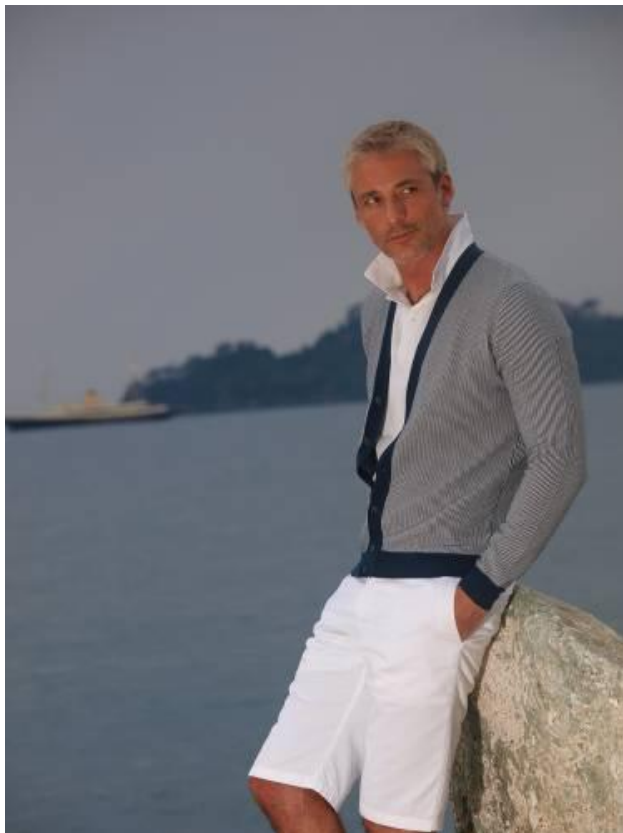
Кардиган RICHE 1AEZ2F Бриджи RE490X