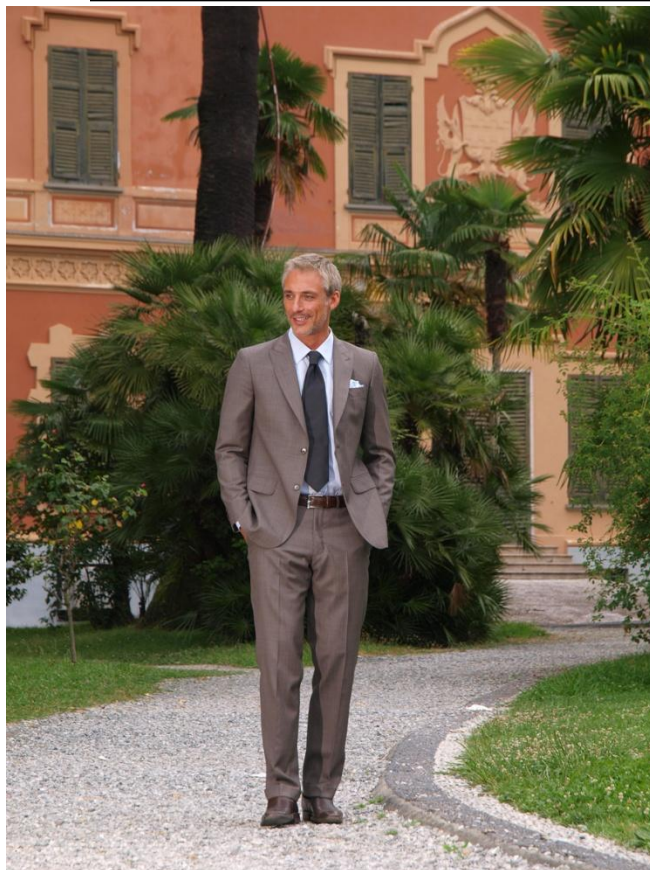
Костюм CLASSICO A2NP