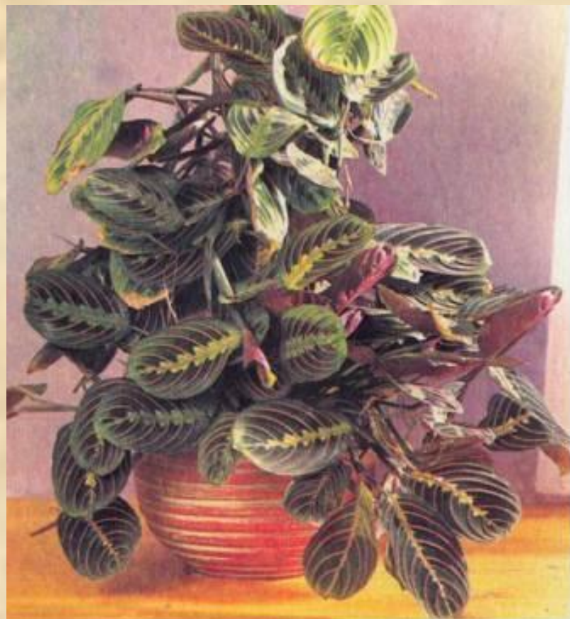
Маранта беложилчатая ( Maranta leuconeura 'Fascinator')