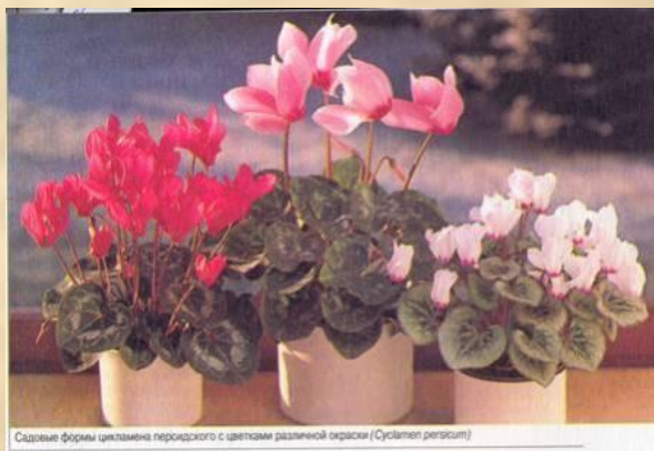
Садовые формы цикламена персидского с цветками различной окраски (Cyclamen persicum)