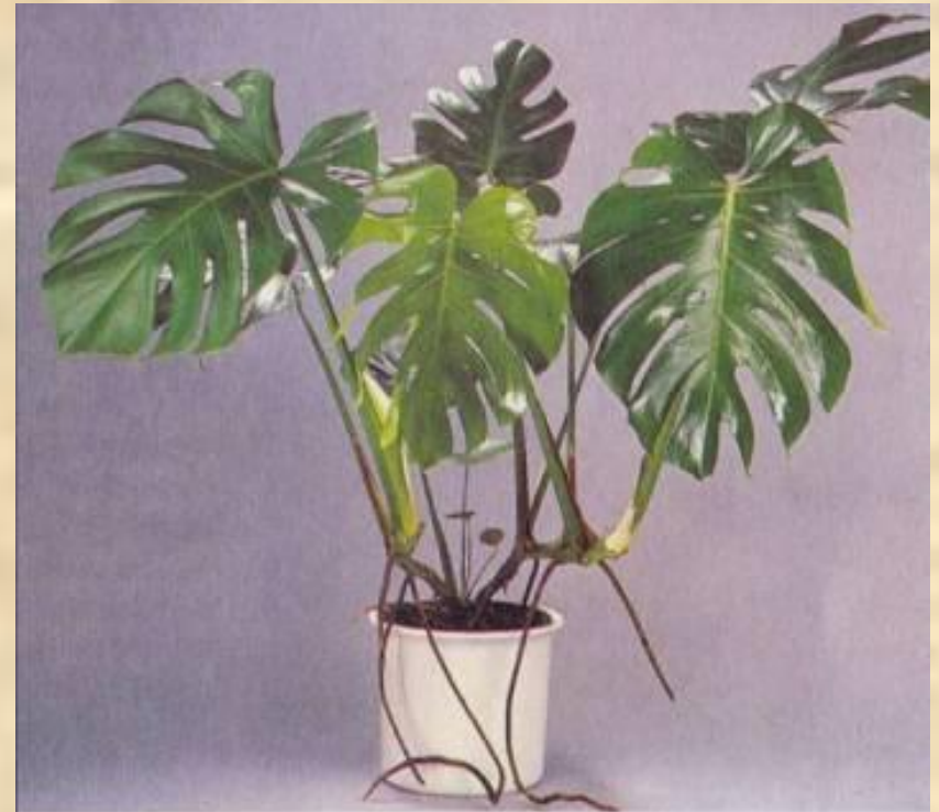
Монстера деликатесная ( Monstera deliciosa )