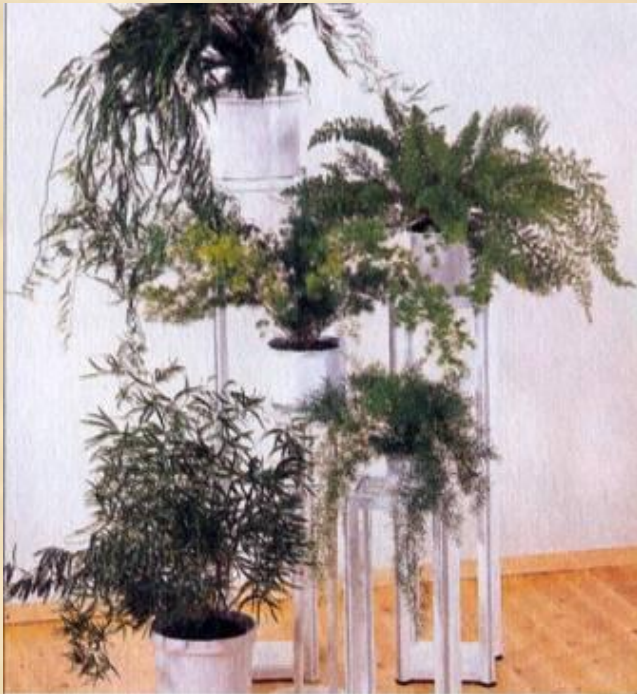
Сл. напр.: аспарагус серповидный, а. перистый, а. густоцветковый ( A. falcatus , A. setaceus , A. densiflorus )