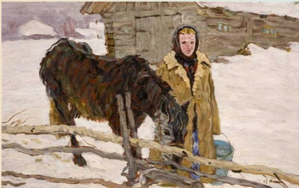
Девушка с лошадью. Ткачев А.П. 1956