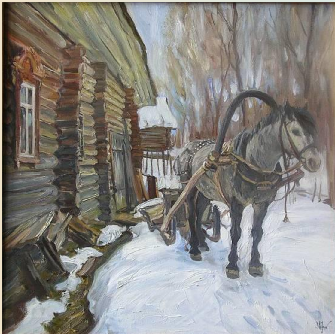
Зима Фаюстов М.В.2004