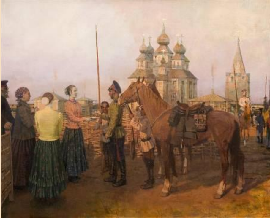
Казачьи проводы. Гавриляченко С.А. 1997