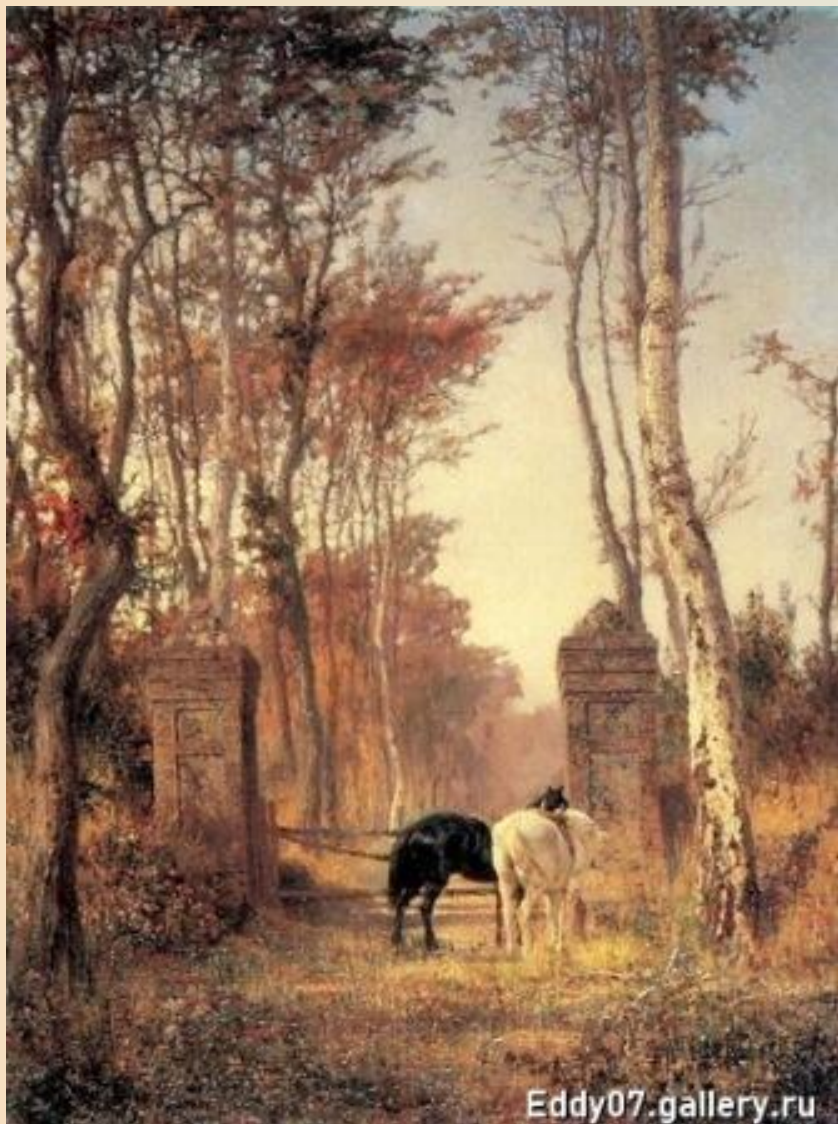
Поленов В.Д 1874