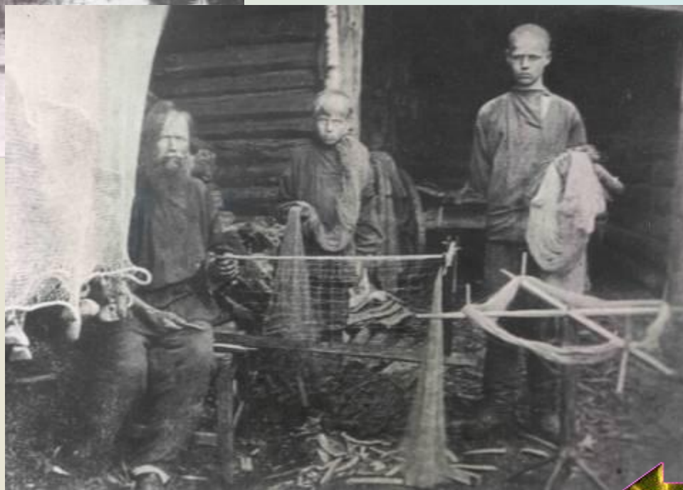
Вязание сетей. Заонежье. Начало XX в.