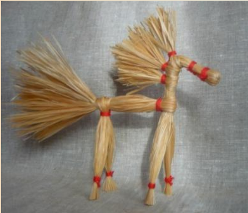
17. Солнечный конь готов