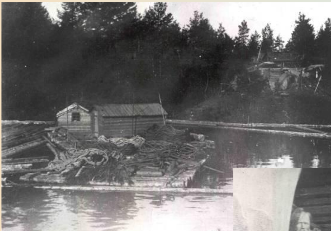
Канаты и верёвки на сплавном плоту. Заонежье. Начало XX в.