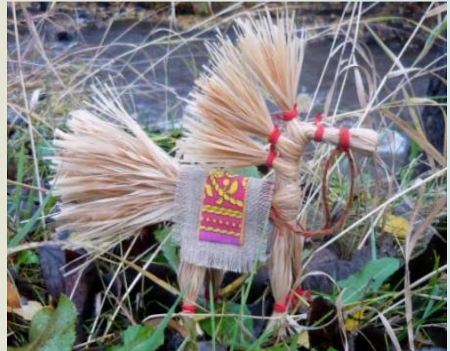
18. Конька можно украсить уздечкой и седлом.