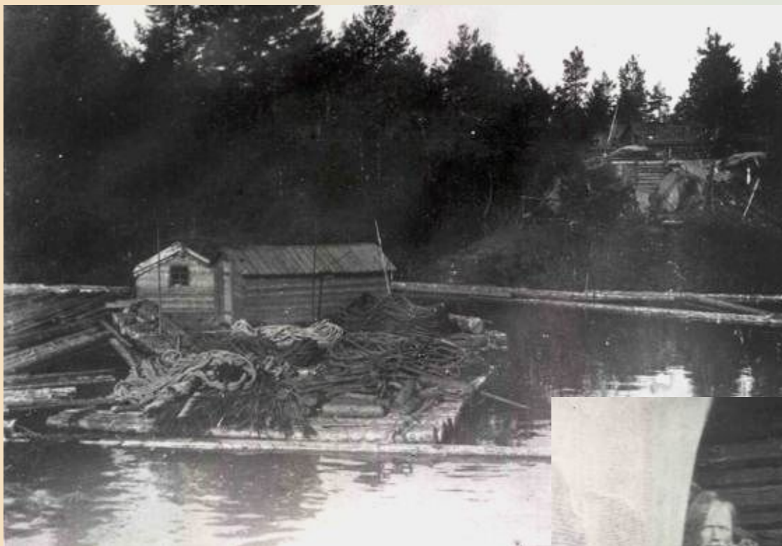
Канаты и верёвки на сплавном плоту. Заонежье. Начало XX в.