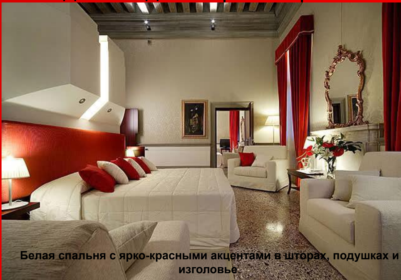
Белая спальня с ярко-красными акцентами в шторах, подушках и изголовье

Красный цвет в интерьере - король цветов, он сразу привлекает к себе внимание. Красный является одним из трех основных цветов, его палитра варьируется от теплого оранжево-красного до холодного красно-фиолетового.