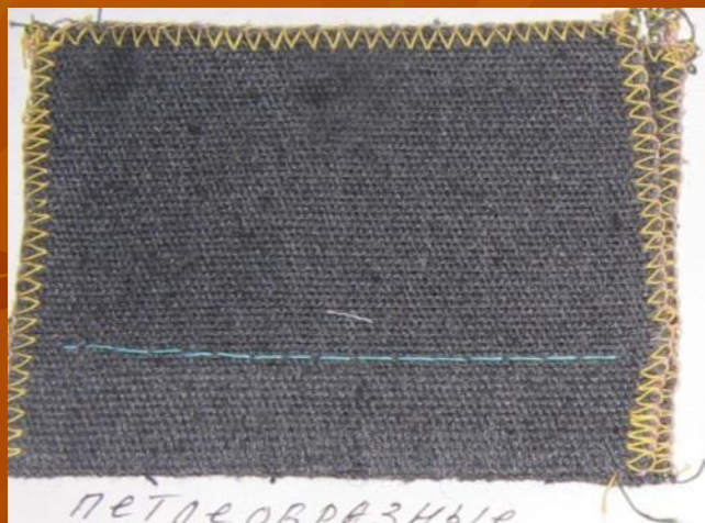
петлеобразные стежки (стачивающая) строчка