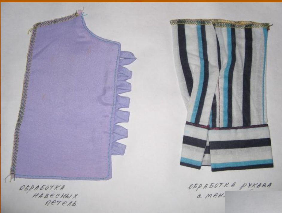
ОБРАБОТКА НАВЕСНЫХ ПЕТЕЛЬ