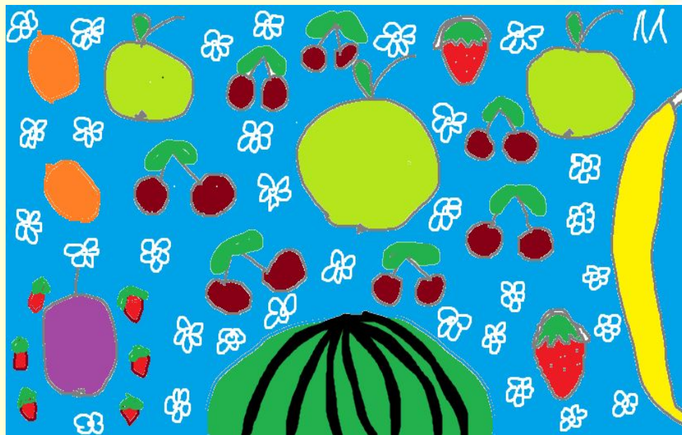
Примерная схема , автор Соня 6 лет

И поле ромашек ... дегустационный сектор и сектор отдыха (гамаки, шезлонги, качели, коврики для пикника)