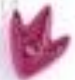
утиная лапка (плечья лапка)