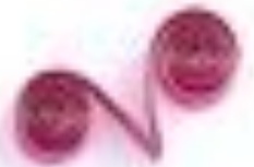
завиток в форме V