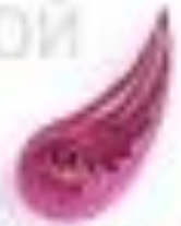
изогнутая капля (крыло, лепесток)