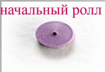
Базовая форма модуля