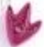
утиная лапка (плечья лапка)