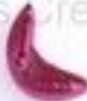
изогнутый полукруг (месяц, полумесяц)