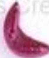
изогнутый полукруг (месяц, полумесяц)