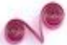
завиток в форме V