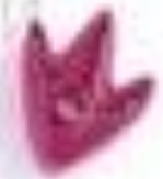
утиная лапка (плечья лапка)