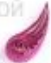
изогнутая капля (крыло, лепесток)