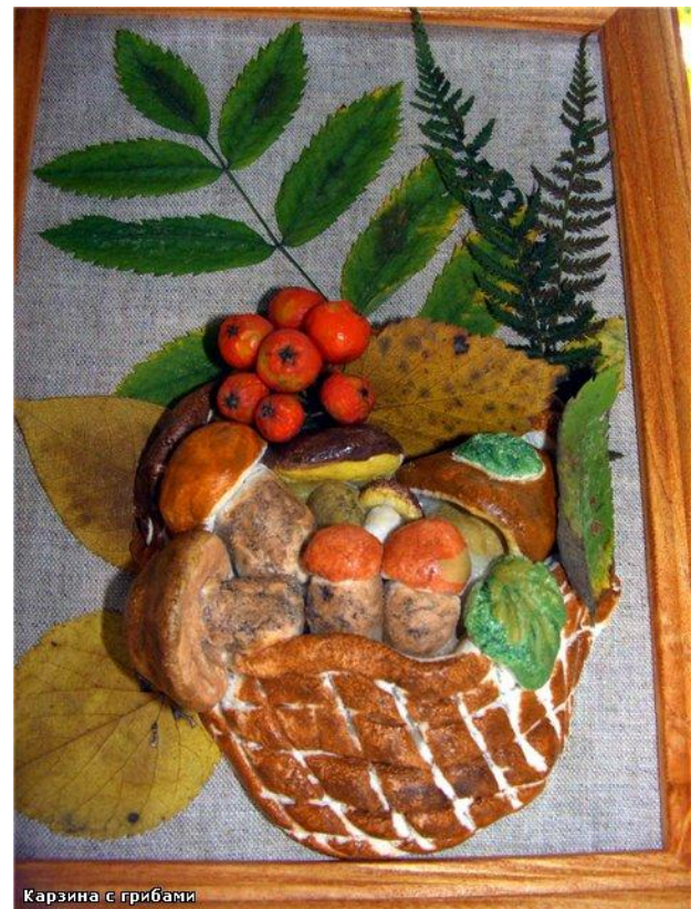
Корзина с грибами

Отличительной особенностью при работе с этим материалом является то, что в процессе работы не требуется никаких специальных инструментов и приспособлений. Лучше всего лепить руками или использовать примитивные инструменты, которые всегда под рукой. Необходимо отметить, что изделия из соленого теста довольно тяжелые (плотные), что не позволяет создавать композиции крупных размеров. Поэтому объемные композиции и панно не должны быть очень большими.