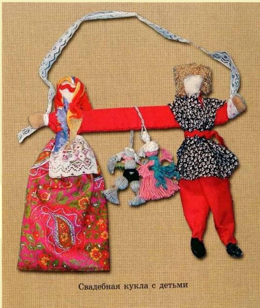
Свадебная кукла с детьми

Красовалась неразлучная пара со своим потомством в красном углу избы под иконами.