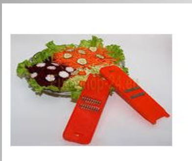
терка для соломки