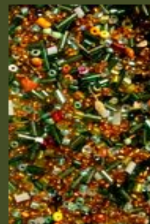
БИСЕР, БУСИНЫ РАЗНОГО РАЗМЕРА