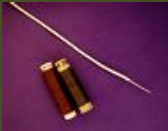
НИТКИ, ПРОВОЛОКА АЛЮМИНИЕВАЯ