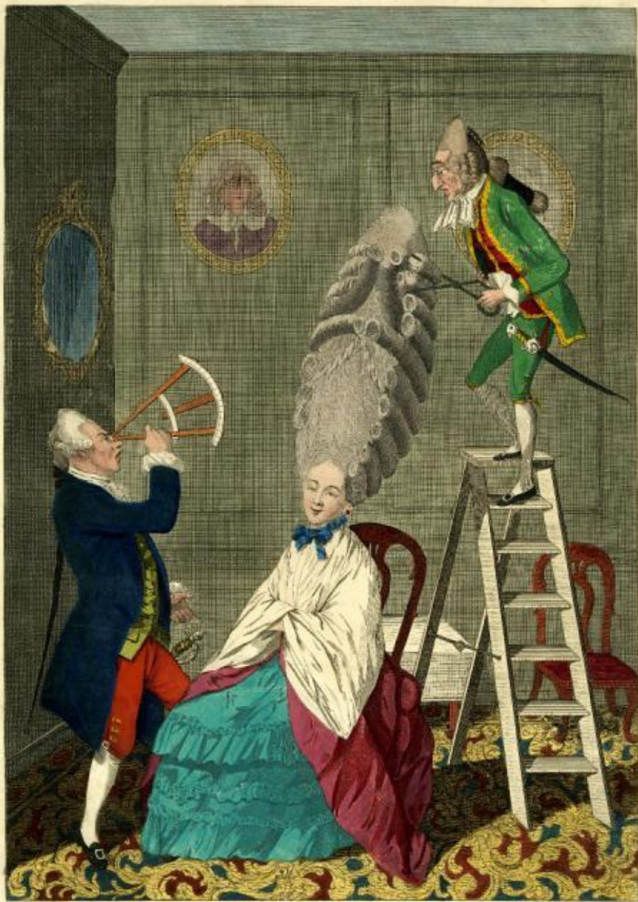
RIDICULOUS TASTE OR THE LADIES ABSURDITY.

Printed & Sold by Peter A. Colwell, No. 10, South Street, New York.