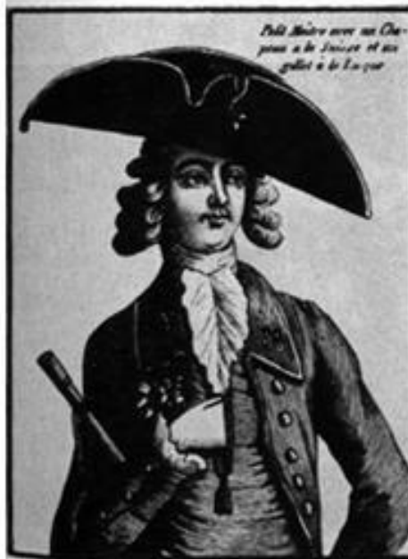
Petit Maître avec un Chapeau à la Française et un gilet à la Turque