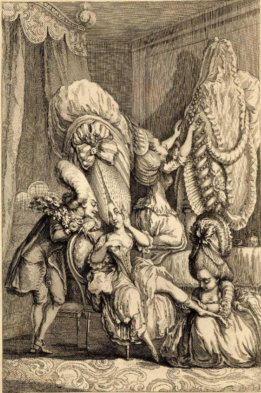
LA BRILLANTE TOILETTE DE LA DÉE DU COUT