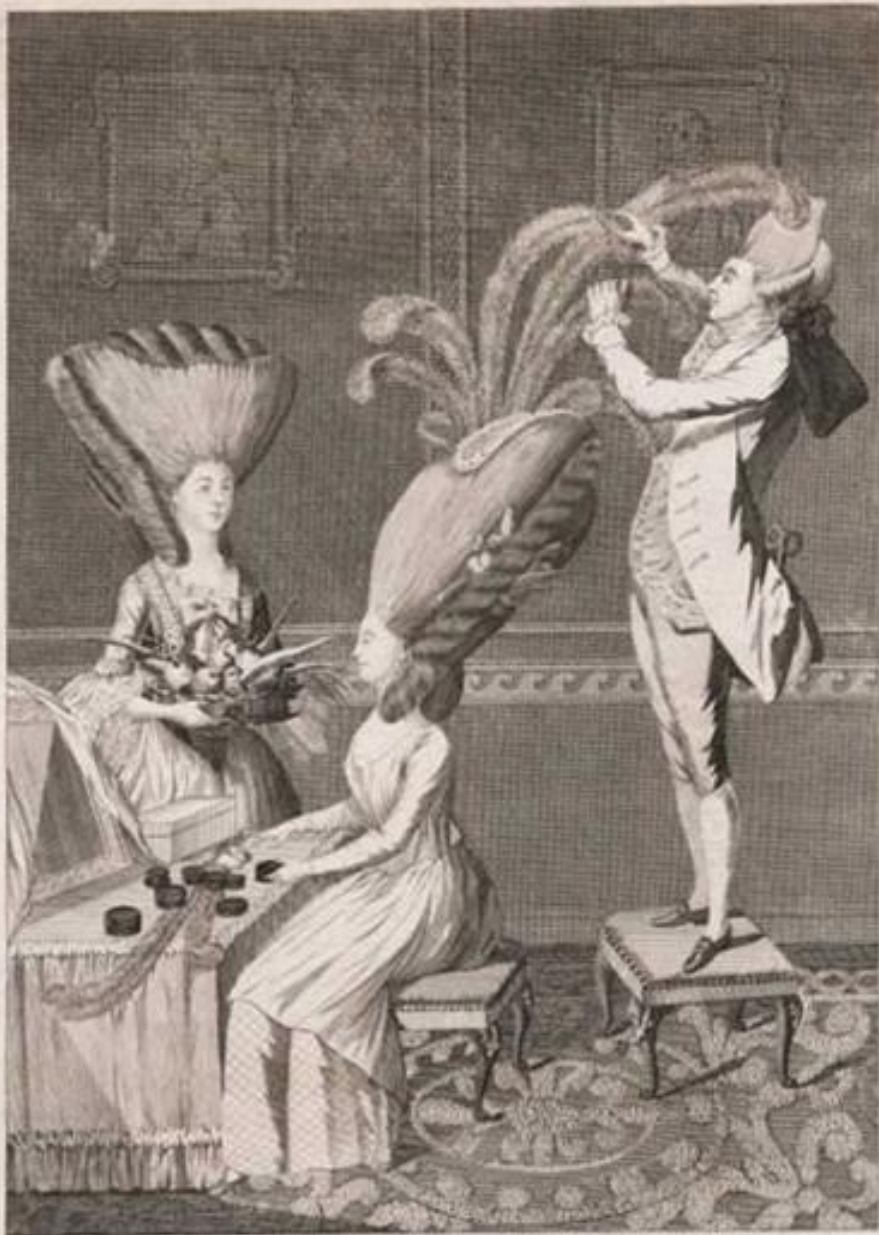
THE PREPOSTEROUS HEAD DRESS, or the FEATHERED LADY