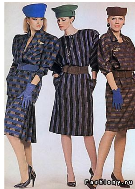
1990-2000. В моду плотно входит минимализм