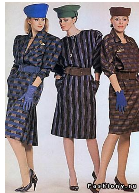
1990-2000. В моду плотно входит минимализм