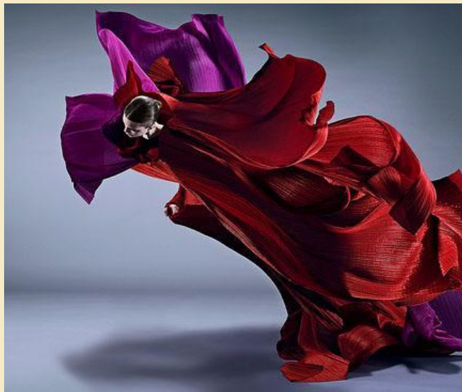
Из фотосессии моделей в плиссе