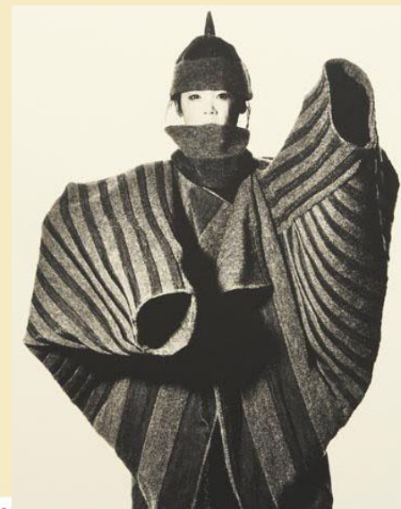
По мотивам 1917 года