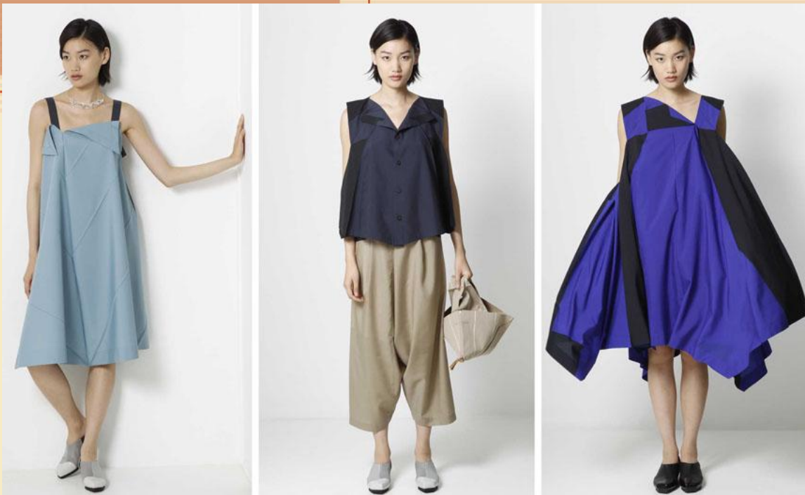
Модели линии «132.5» «весна-лето 2014»

Модели Мияке, японские по корням, западные по духу и универсальные по принципу, — нечто большее, чем одежда. Свободная, часто бесформенная, она напоминает одеяния буддистских монахов с их гармонией, простотой и смирением — прямоугольные лоскуты их ряс, внешне напоминавшие лохмотья, на самом деле были сотканы из тончайшей старинной ткани.