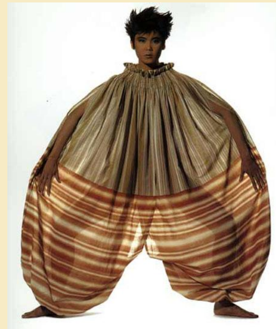
Из коллекции «The dist»