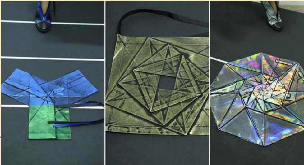
«Оригами наоборот» в бутике

Модели такой одежды представлены в бутике сложенными в плоские фигуры. Если потянуть за уголок вверх, получится платье, юбка или топ.