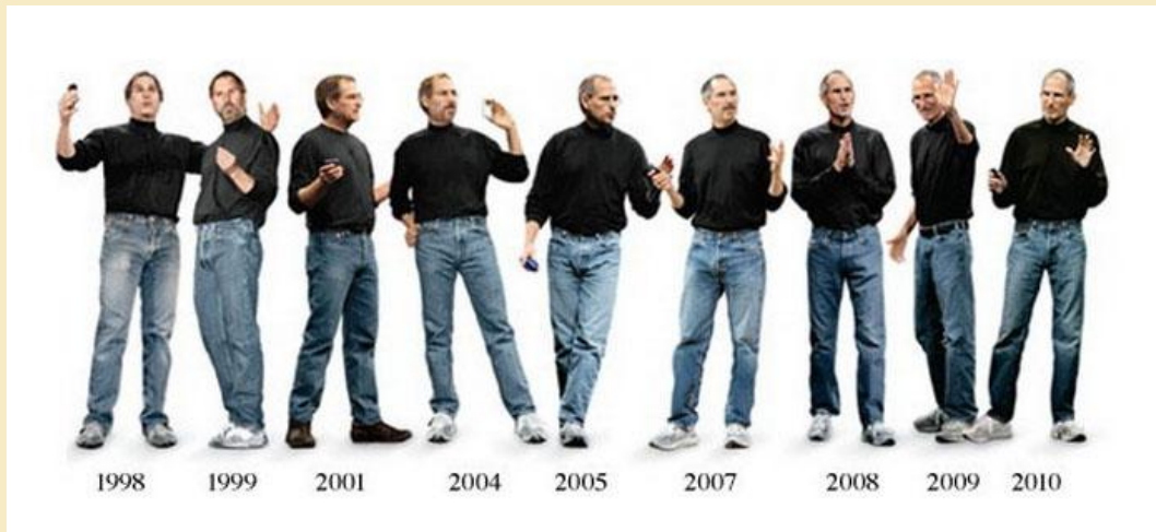
Стиль Стива Джобса

Черная водолазка Мияке, с которой не расставался Стив Джобс, вошла в энциклопедию моды, как маленькое черное платье Коко Шанель.