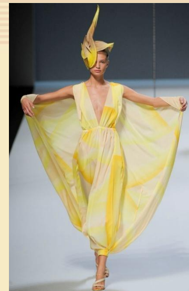
Шляпка в форме экзотической птицы 2011

Презентация подготовлена Е. Князевой по материалу А. Грачевой Журнал «Искусство» № 7–8/2014