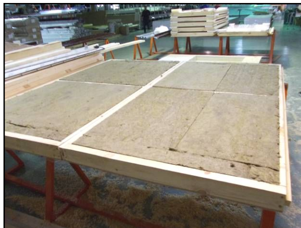
Каркас с утеплителем