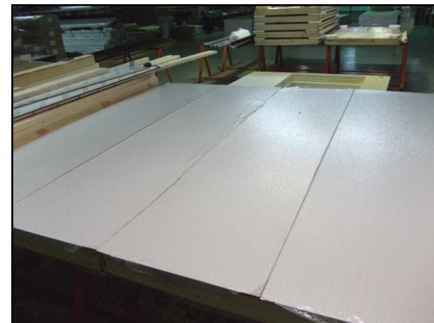
Панель в сборе