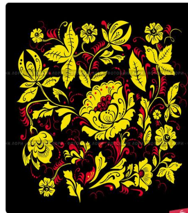
Узор под названием "Кудрина" в стиле традиционного народного искусства