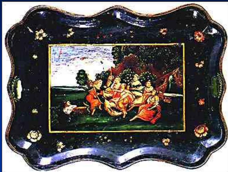
Поднос с сюжетной росписью. Металл, роспись. Худояровы. Первая половина XIX в.