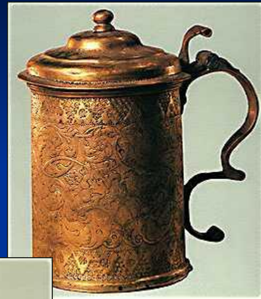
Кружка. Нижнетагильский завод. Медь. 1750 год.