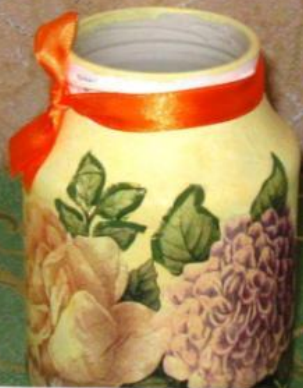
«Красавицы из сада» Работа Михайлова Иллариона