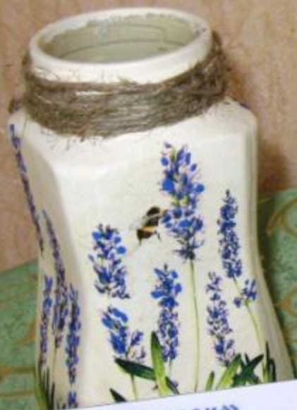
«Летний лужок» Работа Чуриловой Виктории