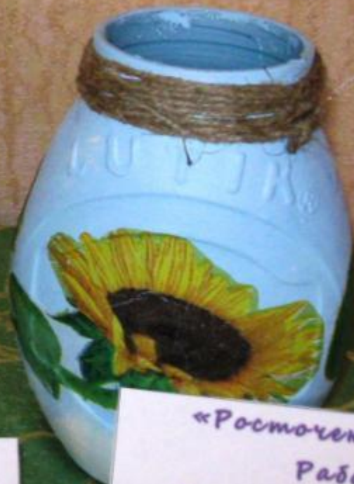
«Росточек радости» Работа Хапёрского Николая