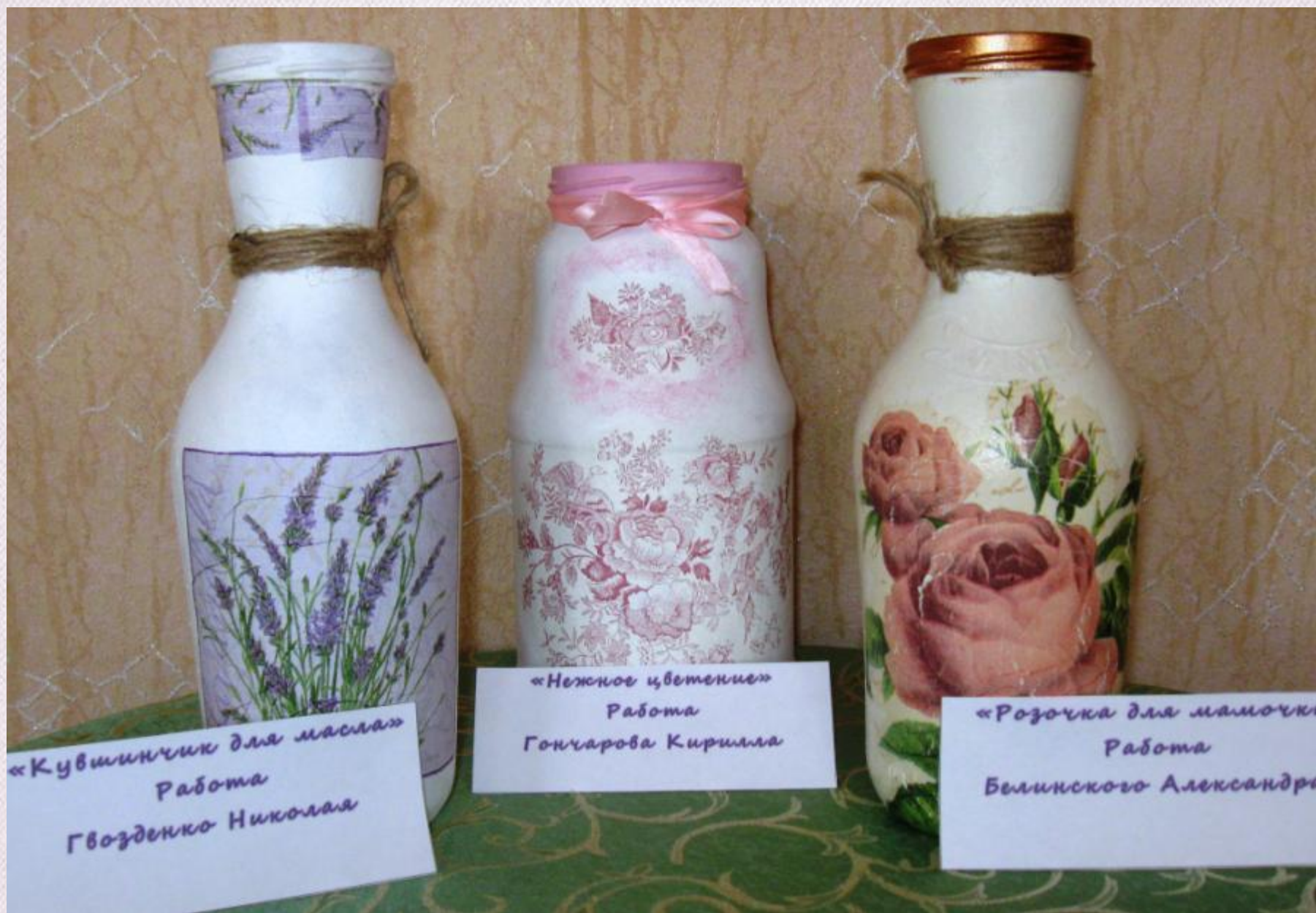
«Кувшинчик для масла» Работа Гвозденко Николая