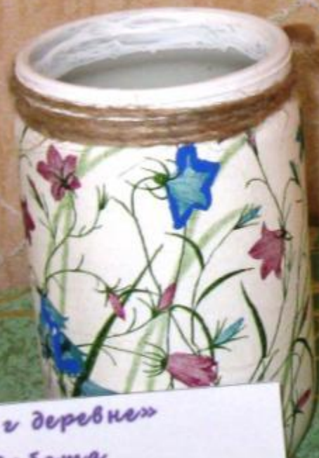
«Луг деревни» Работа Ивановой Ксении