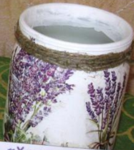
«Хуторской приветик» Работа Черепкова Дениса