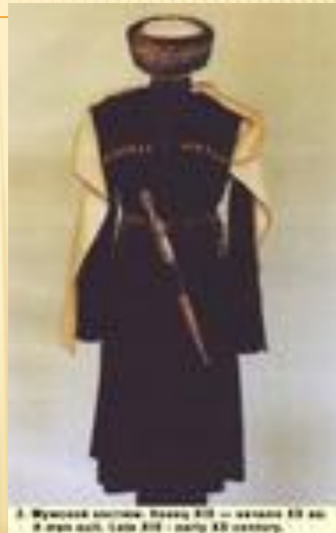
3. Мусульманская одежда. Черкеска XIX — начало XX вв. Muslim dress, late XIX — early XX century.

Естественно, что вышеописанный базовый костюм в различных ситуациях мог дополняться другими элементами одежды, либо утрачивать некоторые детали. Так, как правило, черкеска не надевалась адыгскими крестьянами, работавшими в поле, для защиты от солнца им служил войлочный головной убор в форме шляпы с широкими полями. Зимний комплект одежды утеплялся подкладкой или изготовлялся из более плотных материалов