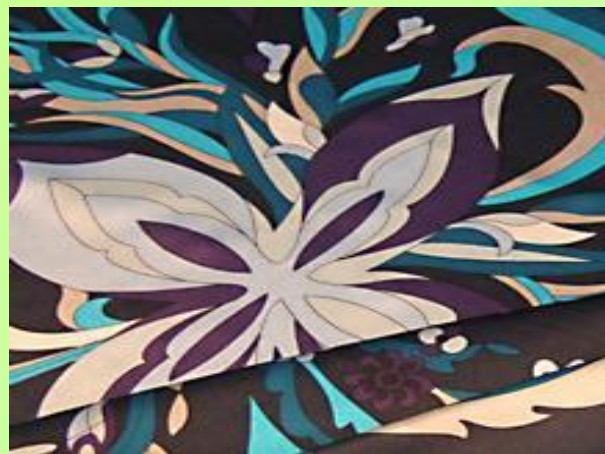
Стрейч - атлас