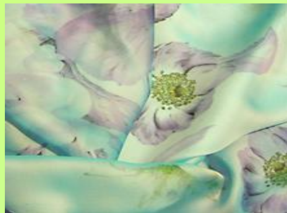
Ткань - хамелеон