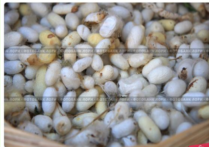
Кокон тутового шелкопряда