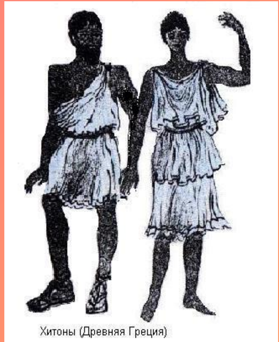
Хитоны (Древняя Греция)

Мужской костюм греков состоял из нескольких кусков ткани, которые не сшивались, а искусно драпировали тело. Этот костюм состоял из двух частей – нижней рубашки, хитона , и верхней накидки, именуемой гиматием .