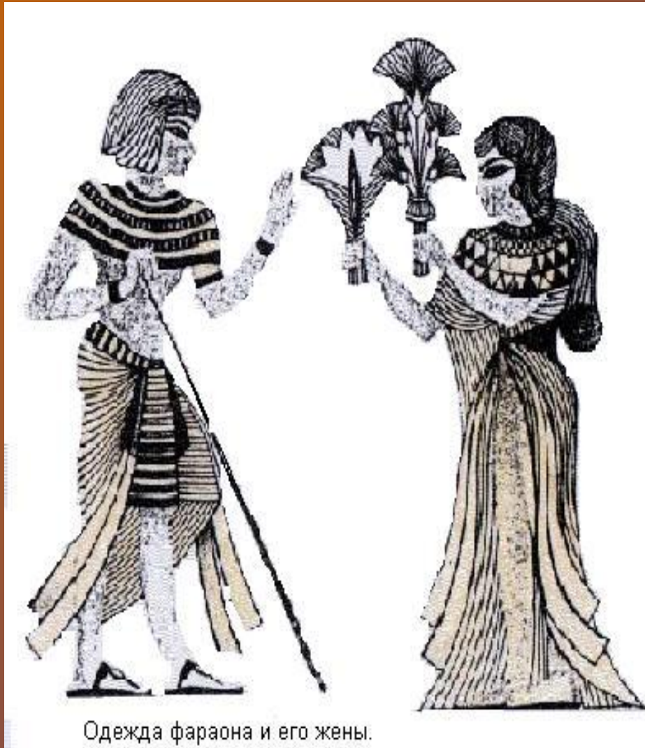
Одежда фараона и его жены.

Костюм во все времена остается визитной карточкой человека. Ткани на одежду рабов в рабовладельческих государствах - Древнем Египте, Древней Греции, Древнем Риме шли самые грубые, а Египетские фараоны и их приближенные носили тонкие, прозрачные ткани из хлопка и льна.