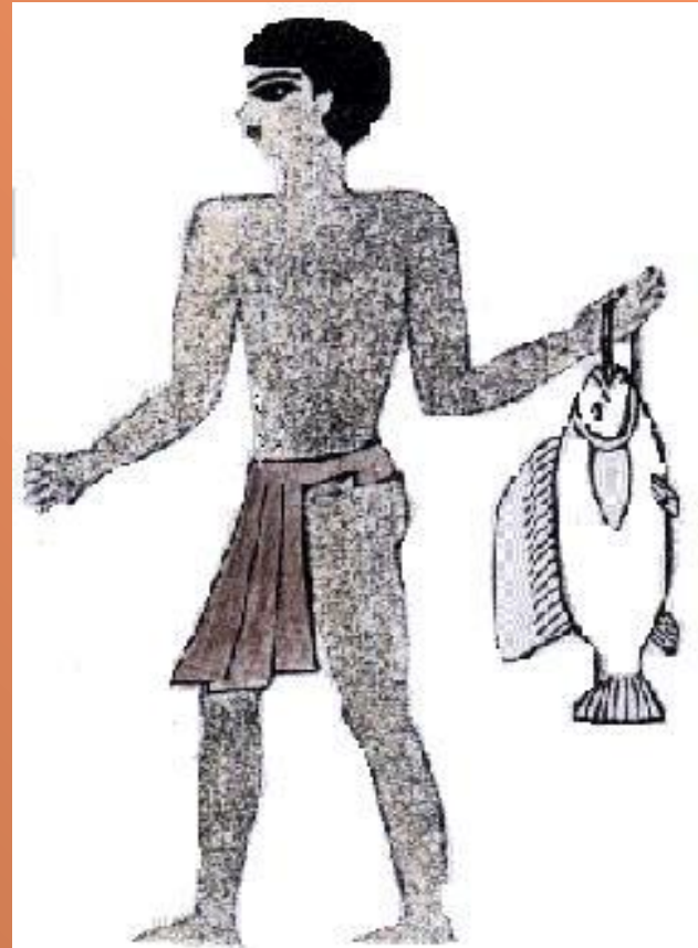
Набедренная повязка из кожи или грубого полотна - одежда раба (Древний Египет)

40 тысяч лет назад люди придумали иглу. Она до сих пор остается главным инструментом для шитья. Позднее человек научился скручивать волокно, затем делать ткань. Большинство книг, посвященных истории костюма, начинаются с описания одежд Древнего Египта.