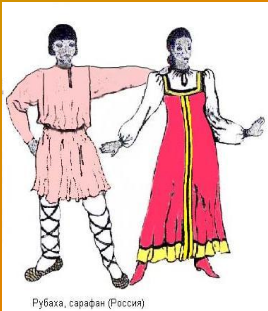
Рубаха, сарафан (Россия)

Традиционный русский костюм мужчин состоял из подпоясанной рубахи – косоворотки, женщины же носили вышитые сарафаны с нижней рубашкой, которую также украшали вышивкой, лентами, бисером.