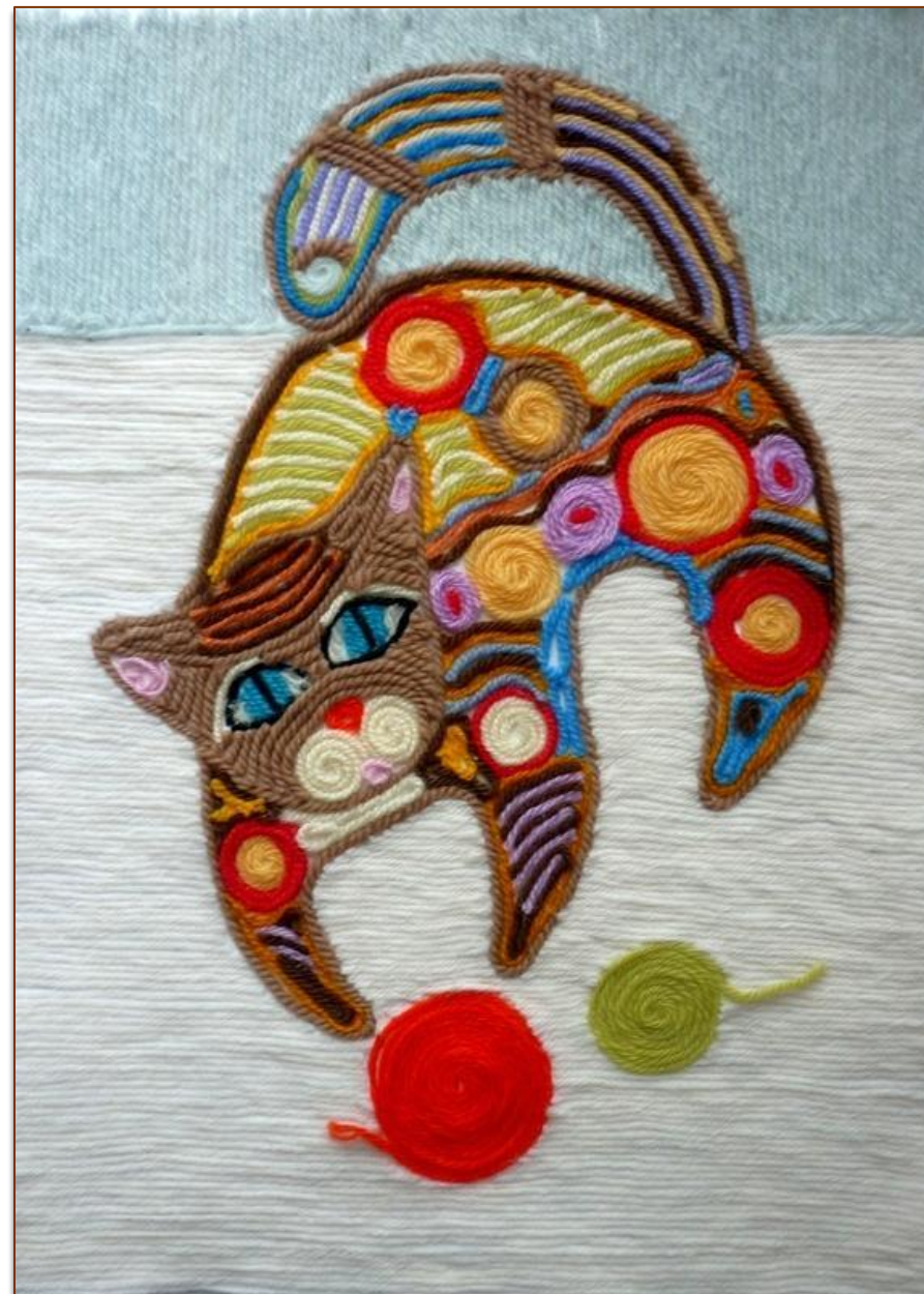
«Шерстяной КОТ» ниткография 30x40