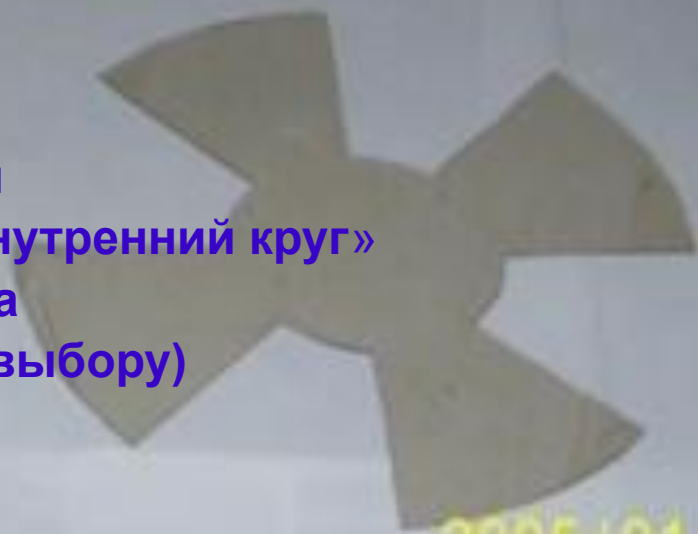
Шаблоны «внешний круг» и «внутренний круг» для цветка ( цвет бумаги по выбору)