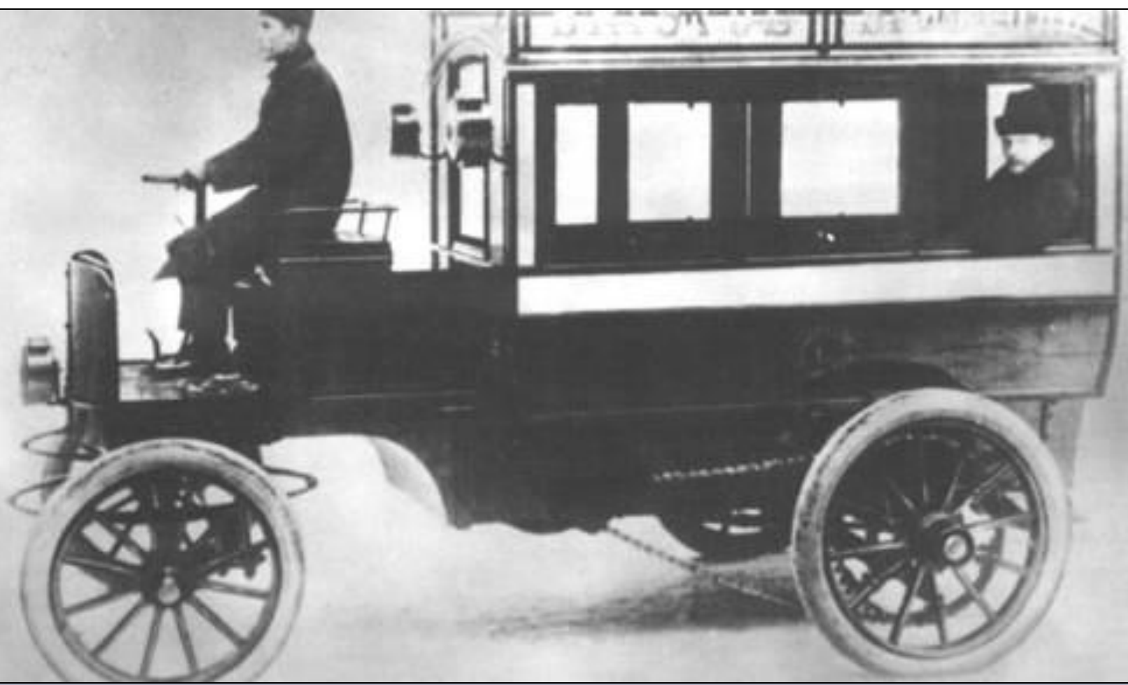
Первый автобус в России.