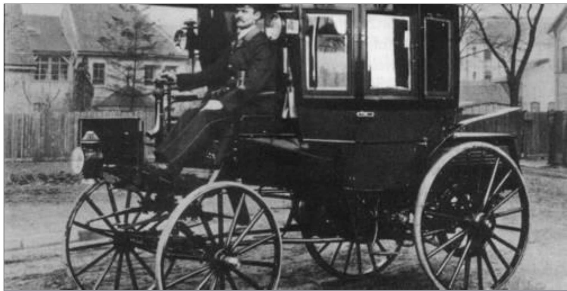
Самый первый автобус .