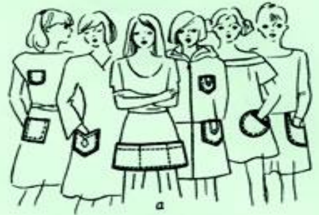
Разновидности накладных карманов