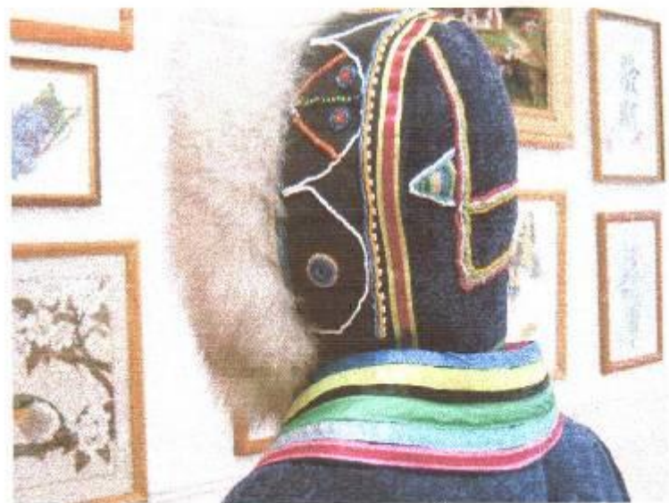
Долганский национальный костюм