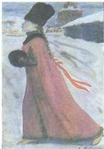
Московская девушка XVII в. Художник А. Рябушкин.