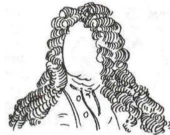
Парик «львиная грива». XVIII в.