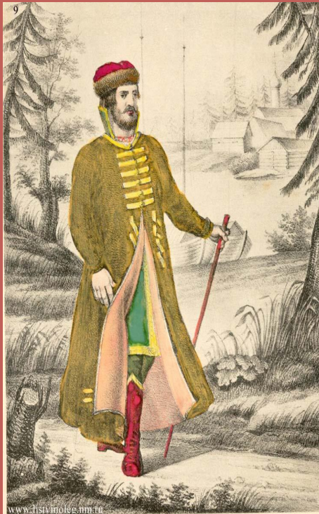
Русская Одежда с XIV до XVIII столетия, ФЕРЕЗЬ И ШАПКА.