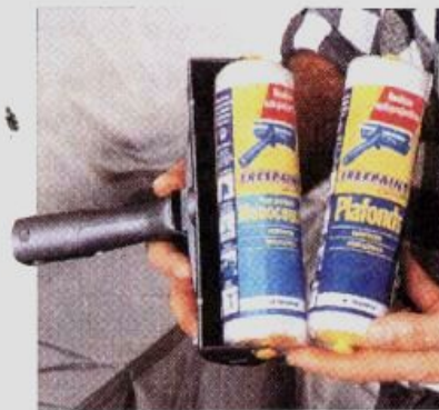
Рис. 11.2.3. Различные типы и конструкции валиков позволяют быстро и качественно наносить лакокрасочные материалы