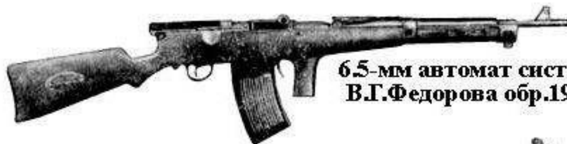
6.5-мм автомат системы В.Г.Федорова обр.1916 г.