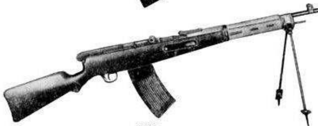
6.5-мм автомат системы В.Г.Федорова обр.1916 г., со складными сошками SAVOK.ORG