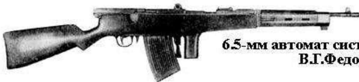
6.5-мм автомат системы В.Г.Федорова