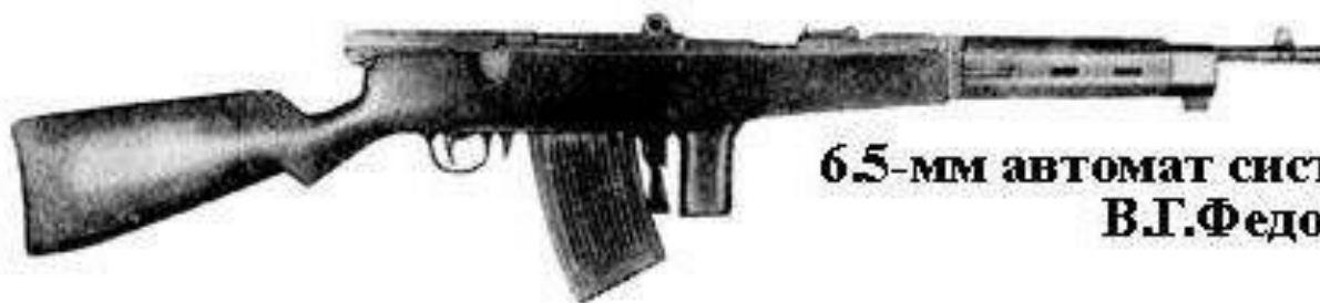
6.5-мм автомат системы В.Г.Федорова