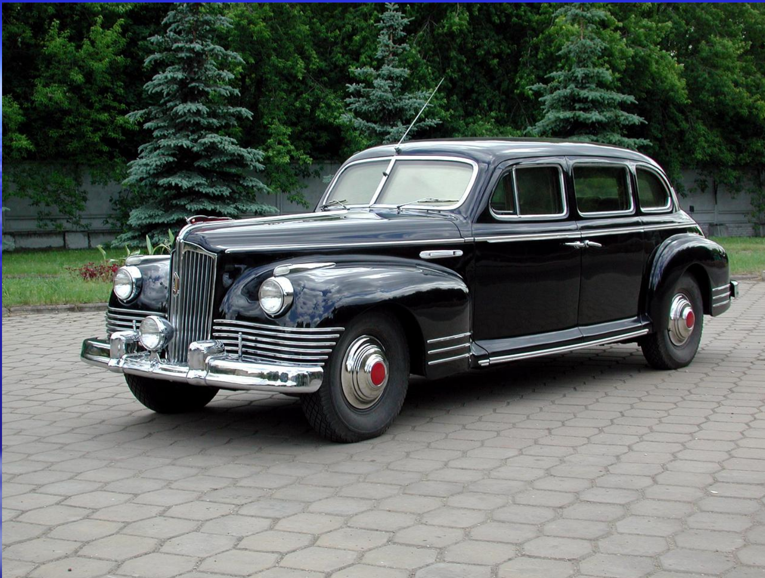
• ЗИС 110