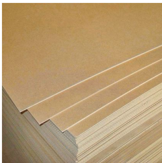
Древесно-волокнистые плиты (ДФП)