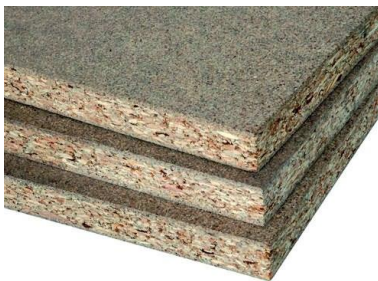
Древесно-стружечные плиты (ДСП)