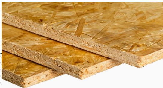
Ориентированно-стружечная плита (ОСП )