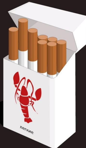
Рис 5. Графический плакат.