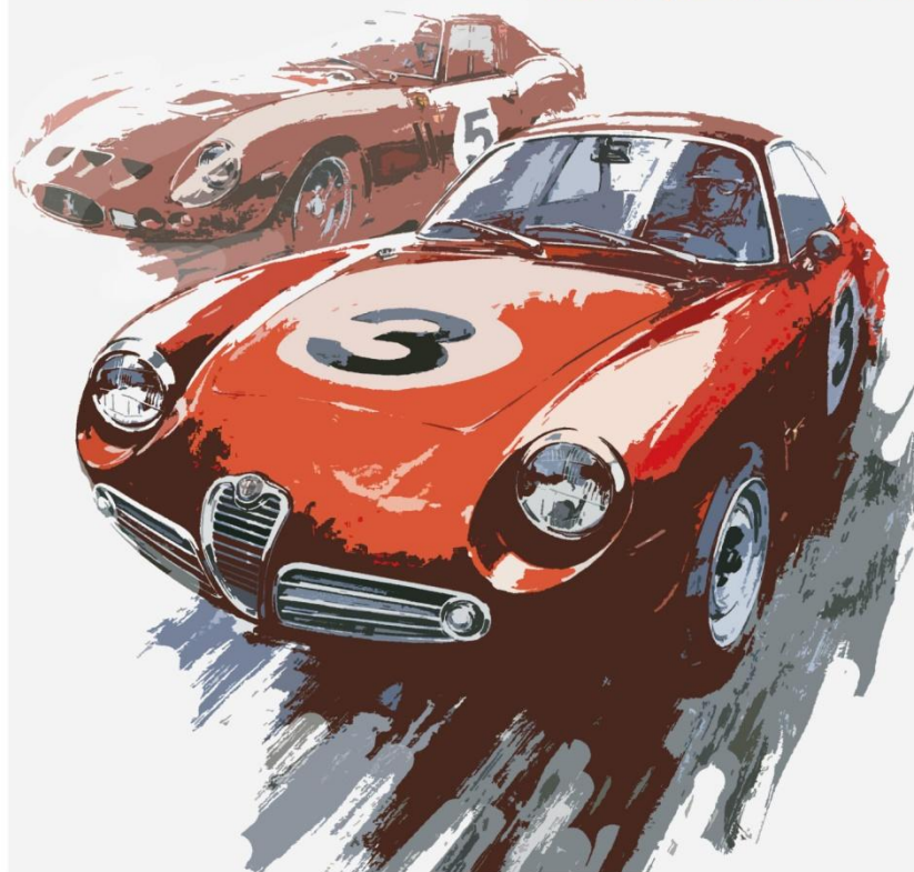
Рис 7. Графический плакат