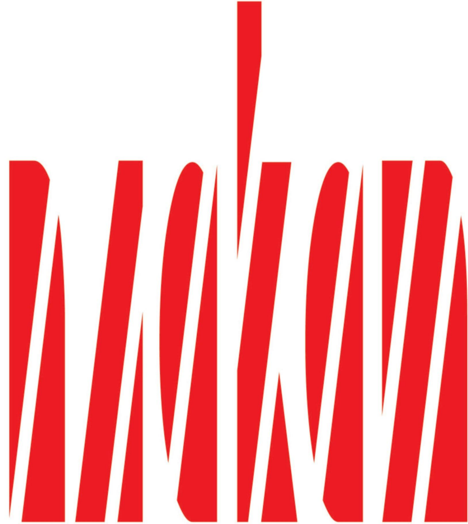
Рис 1. Шрифтовой плакат.