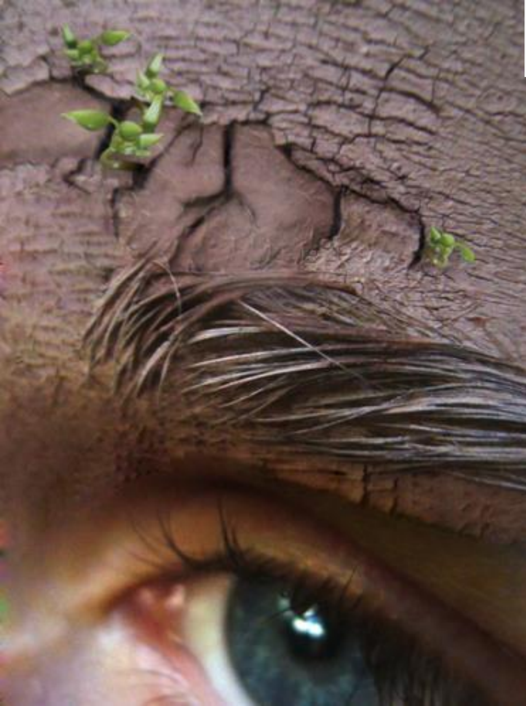
Рис 10. Фотоплакат