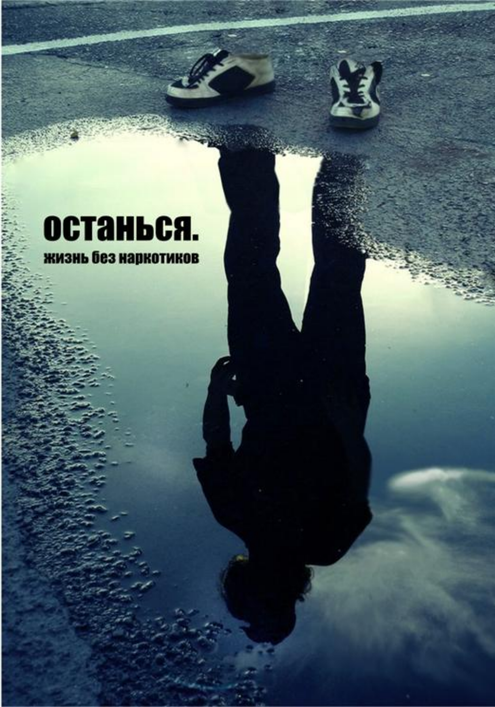
Рис 9. Фотоплакат