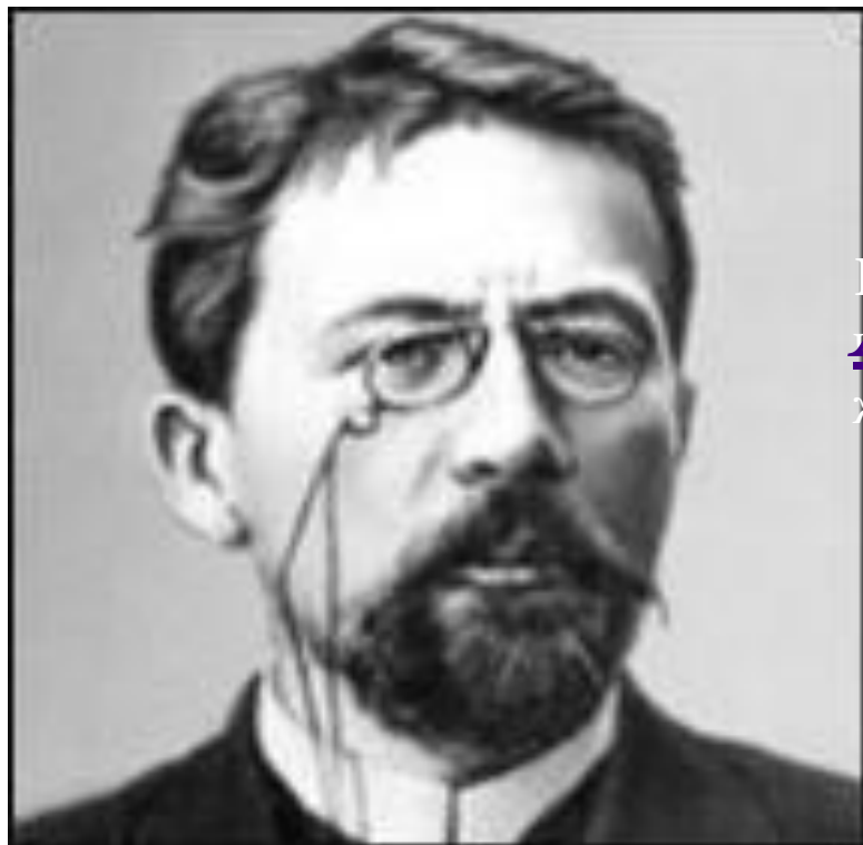
АНТОН ПАВЛОВИЧ ЧЕХОВ

БЕЗ ТРУДА НЕ МОЖЕТ БЫТЬ ЧИСТОЙ И РАДОСТНОЙ ЖИЗНИ.