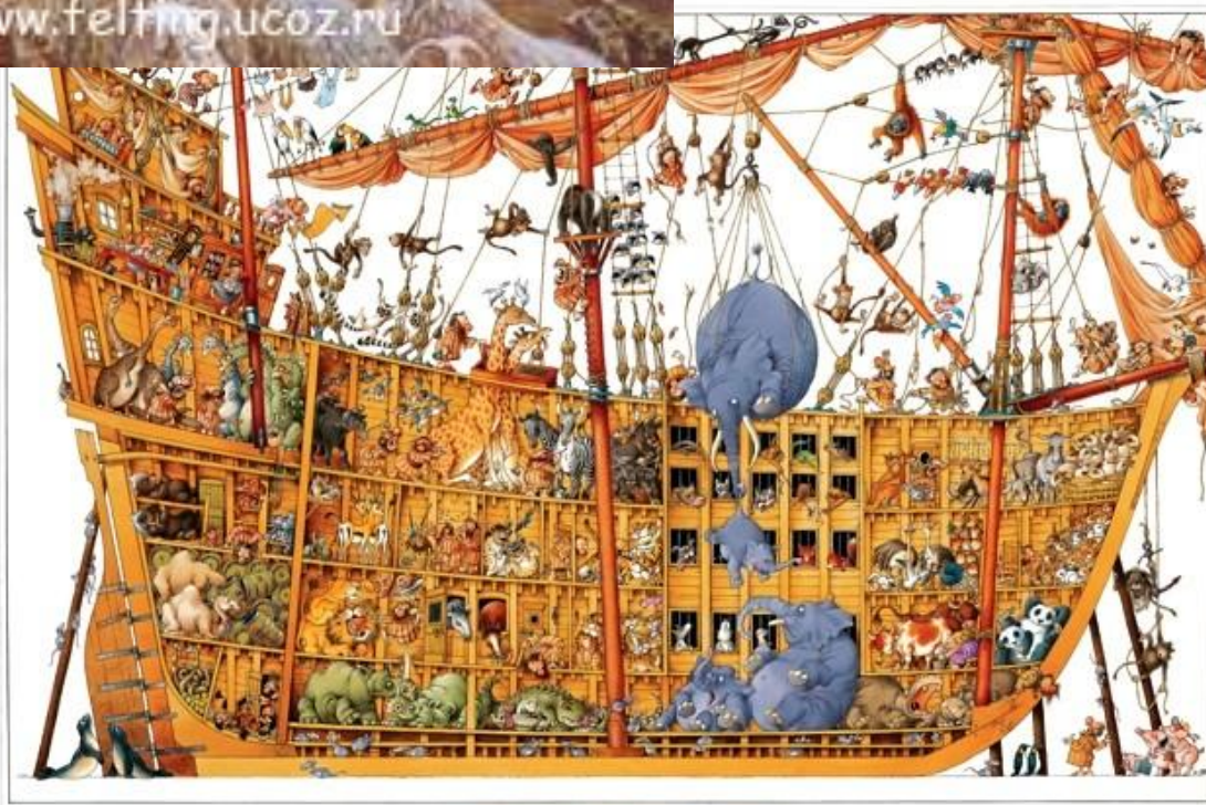
EL ARCA DE NOE • DIE ARCHE NOAH L'ARCHE DE NOE THE NOAH'S ARK • L'ARCA DI NOE