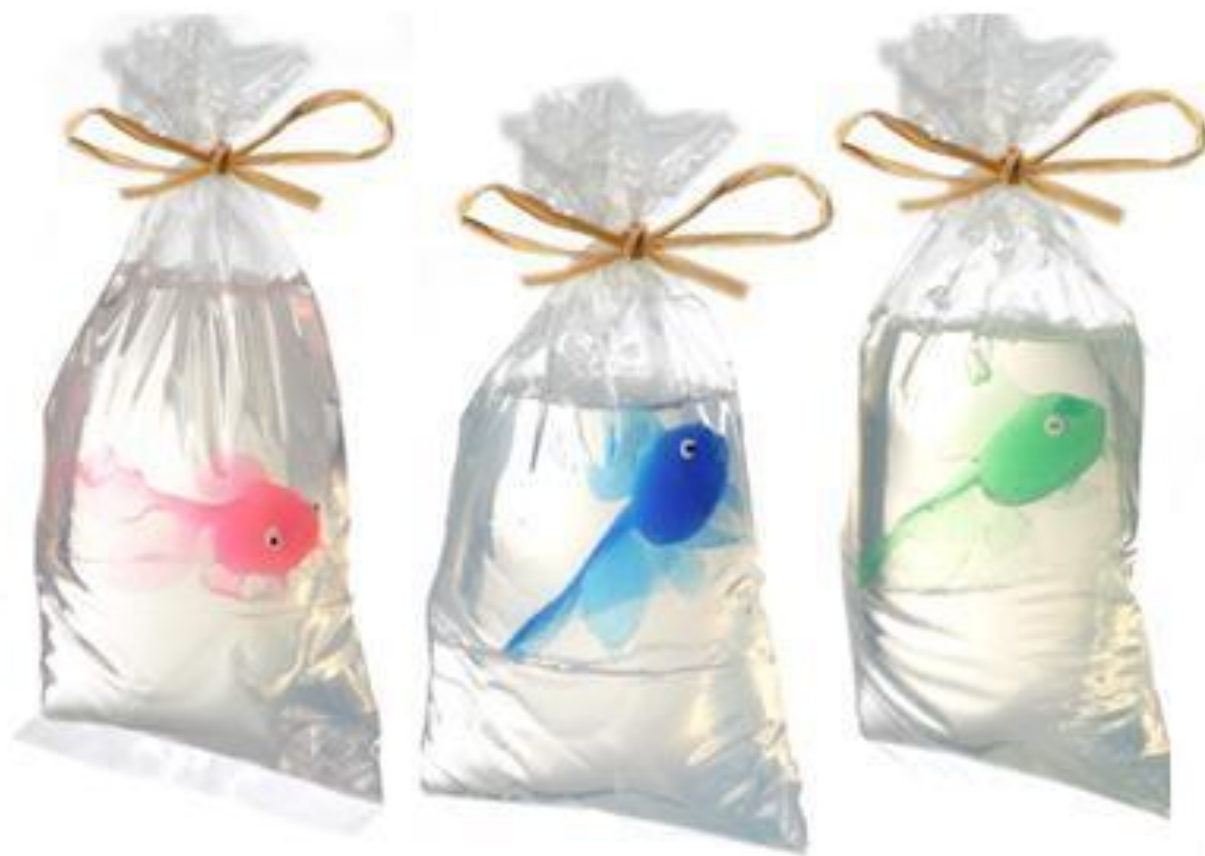
Мыло рыбка в пакете