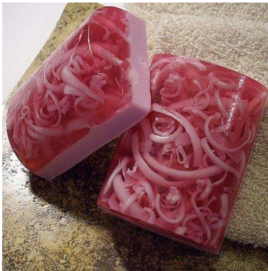
Мыло со стружкой