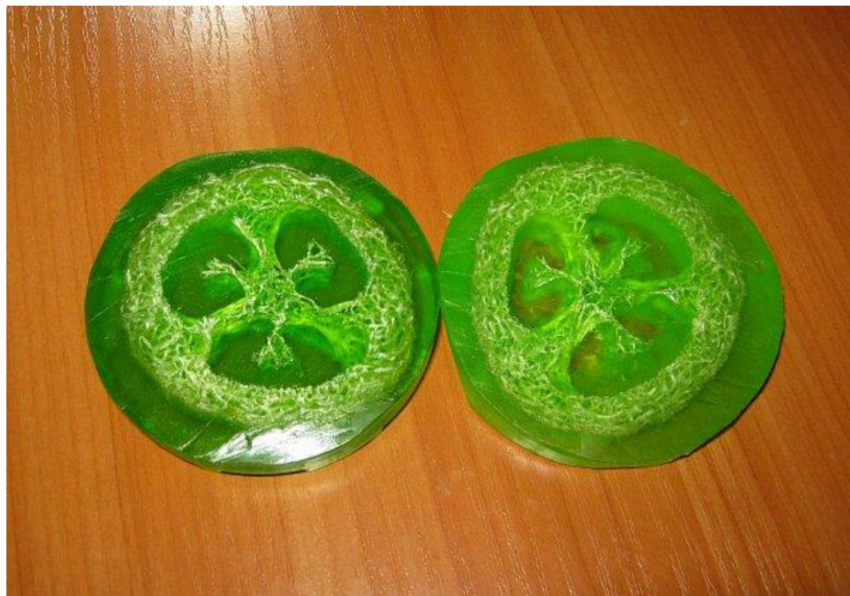
Мыло с люфой