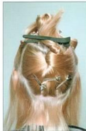
Наращивание волос по Итальянской технологии (на капсулы)

Услуга наращивания волос имеет сегодня большую популярность и распространение.