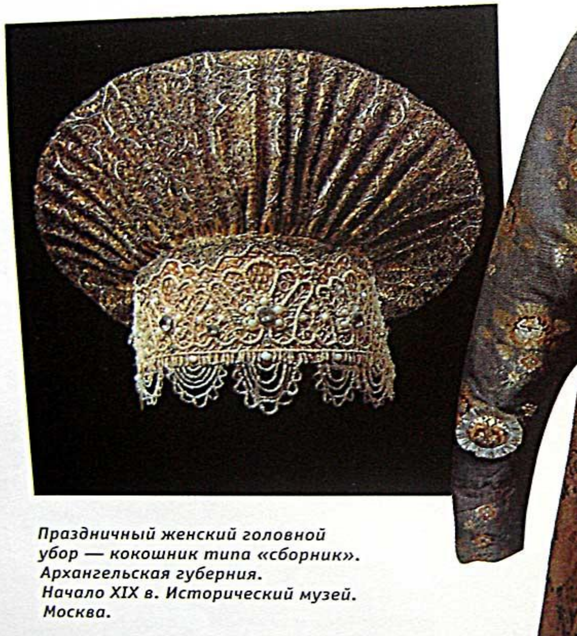
Праздничный женский головной убор — кокошник типа «сборник». Архангельская губерния. Начало XIX в. Исторический музей. Москва.