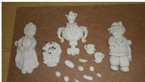
Модель №1 Панно «Чаепитие»