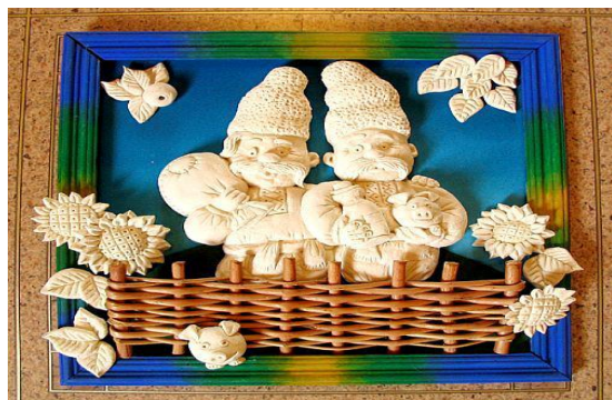
Модель №2 Панно «Два казака»