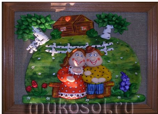
Модель №3 Панно «Свидание на скамейке»