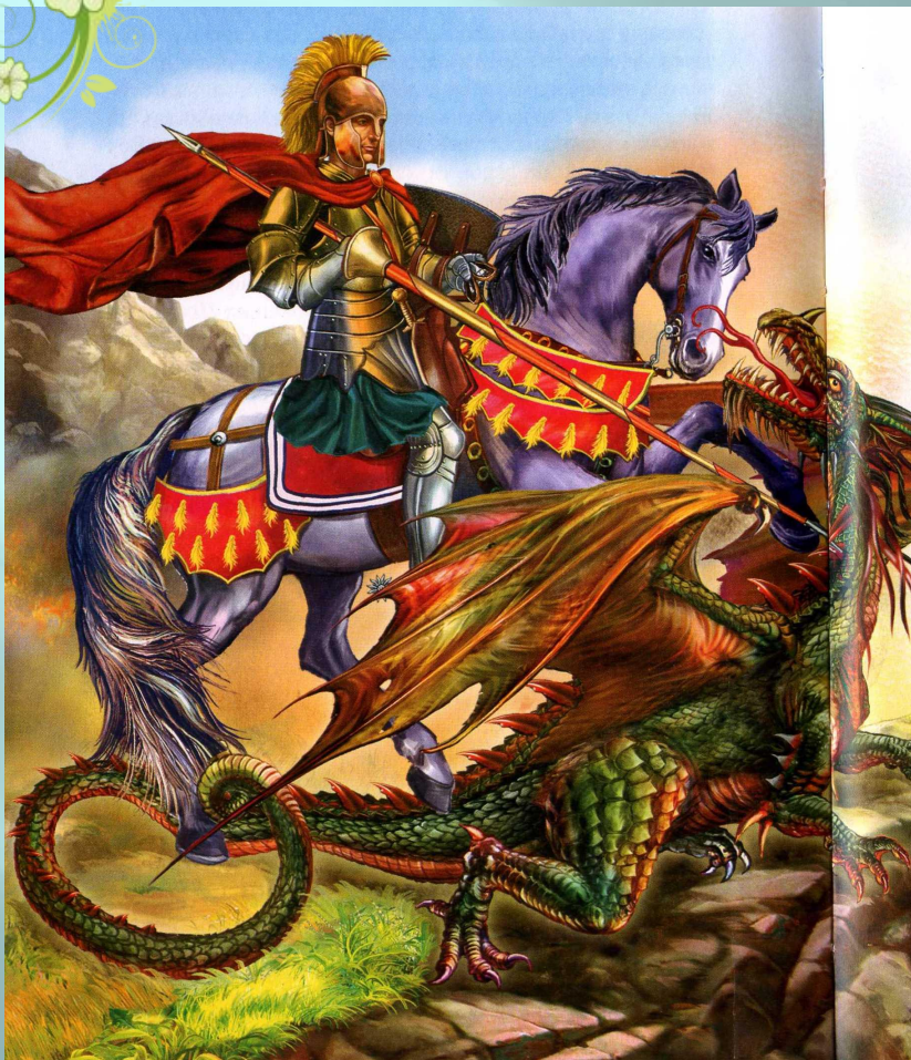
Георгий Победоносец- усмиритель дракона